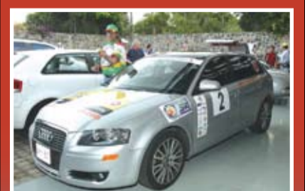
Galería de Fotos Pág. 4