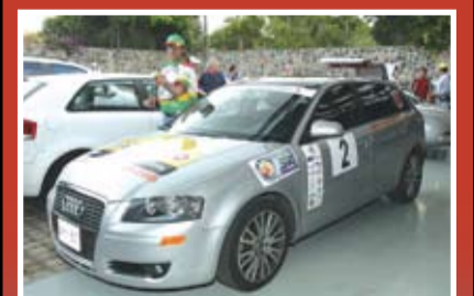
Galería de Fotos Pág. 4