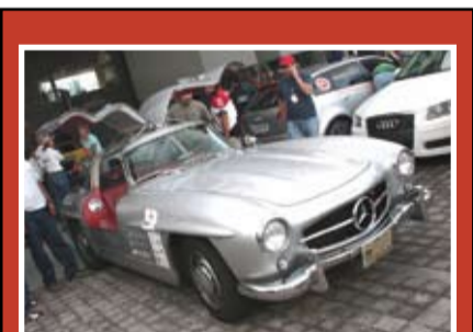
Ganadores de ediciones anteriores Pág. 3